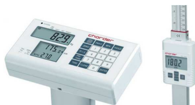
Pasirinktinai su ūgio matuokle