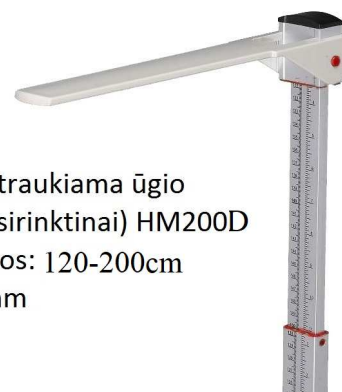
Elektroninė ištraukiama ūgio matuoklė (pasirinktinai) HM200D Matavimo ribos: 120-200cm Gradacija: 1mm